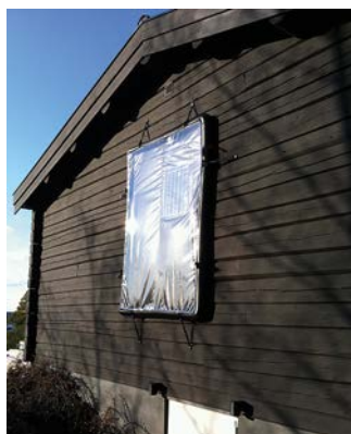
SolTech Flex monterad.