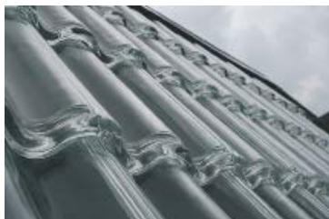
Både ett tak och en solfångare

SolTechs affärsidé är att utveckla, marknadsföra och sälja ett, i en fastighets yttre skal (tak och/eller vägg), integrerat solenergisystem som är flexibelt, hållbart, estetiskt tilltalande och ekonomiskt försvarbart för kunden utan någon form av subventioner, även i marknader med begränsad andel sol.